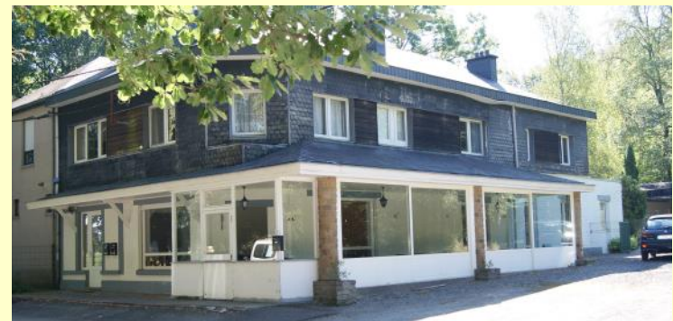
Charmille - 70 Personen (n° 51 auf dem Plan)