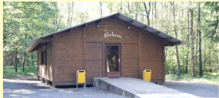
Shabann - 80 Personen (n° 43 auf dem Plan)